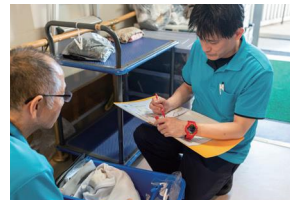
※撮影用にマスクを外しています。

で相談したいという方もいますので、個々のニーズや適正を見て、当事者の皆さんが相談しやすい方法を選択しています。柔軟に個々の特性を認めて信頼できる職場づくりを意識することで、結果的に皆が働きやすい環境が整うのではないのでしょうか。